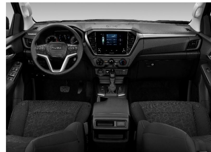
Foto non conformi agli standard contrattuali. I colori effettivi della carrozzeria dei veicoli potrebbero variare leggermente dai colori nelle fotografie stampate in questo catalogo.